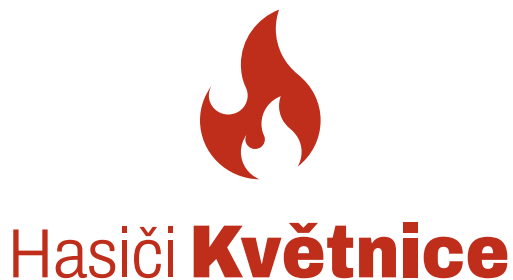
Základní varianta značky

Základní varianta značky, kdy je motiv plamenu umístěn ve středu nad názvem, se používá všude tam, kde je potřeba prezentovat subjekt. Doplnková varianta značky je určena pro případ, kdy z nějakého důvodu nelze použít základní variantu.